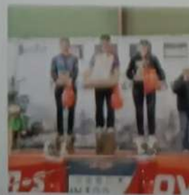
Le podium garçons du 16 km.