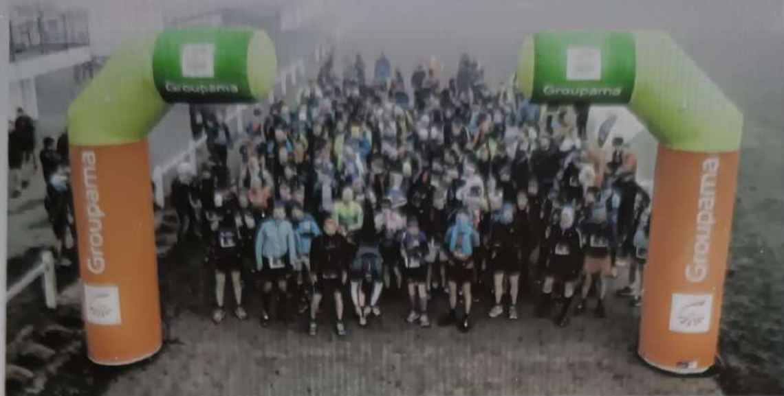
Le départ du 26 km sous la brume même si le soleil a pointé le bout de son nez en fin de matinée.