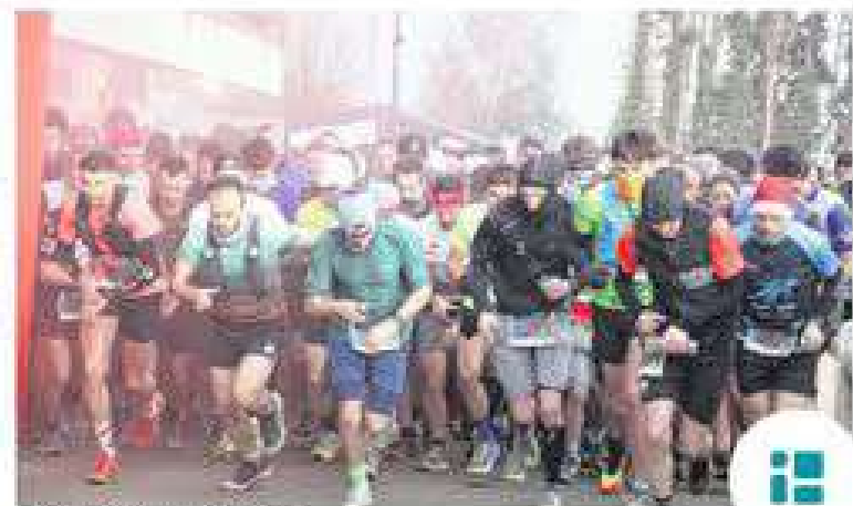
Le départ de l'épreuve du 11 km.