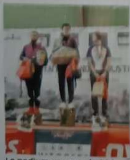
Le podium garçons du 26 km.