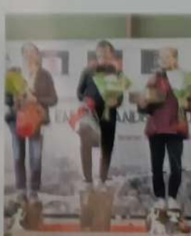
Le podium femmes du 26 km.