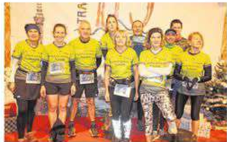
L'équipe de Colpo était bien représentée à cette 3 e édition.