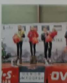
Le podium femmes du 10 km.