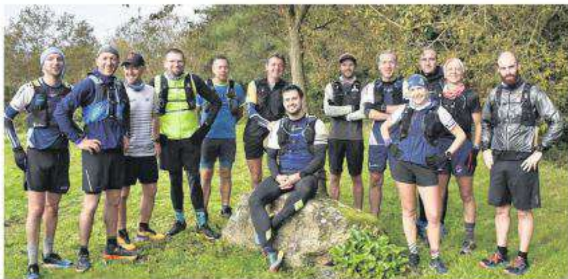
Une partie des licenciés du Brével'Trail qui a participé à la reconnaissance du circuit pour le trail du 17 décembre. Travaille-Casade